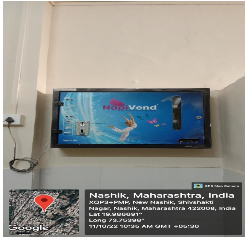
Sanitary Napkin Dispenser Mashine

Specific facilities provided for women in terms of: a. Safety and security b. Counselling c. Common Rooms d. Sanitary Napkin dispenser and incinerator