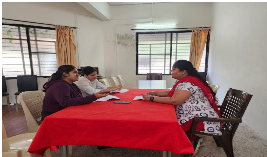
Counseling to girl students